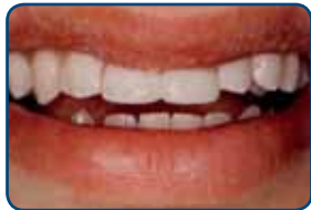
Nog dezelfde dag zijn de tanden met composiet hersteld