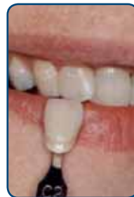
De gewenste kleur bepalen

Eerst kiest de tandarts in overleg met u de juiste kleur van uw facing. Het effect van de gewenste kleur kan de tandarts u direct laten zien. Hij heeft verschillende kleuren tot zijn beschikking die hij met elkaar kan combineren. U kunt het vergelijken met het mengen van verschillende soorten verf.