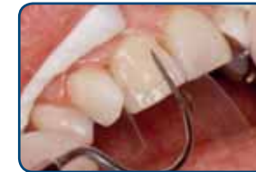
De tandarts brengt de composiet op het oppervlak globaal in vorm

het wegslijpen van een laagje composiet, direct corrigeren.