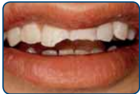
Door een val zijn twee tanden gebroken

Een facing is een laagje tandkleurig vulmateriaal van composiet of een schildje van porselein. De tandarts plakt het vulmateriaal op de tand.