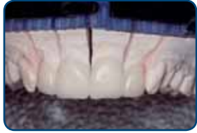
Porseleinen facings op een mal

Uw tandarts maakt een afdruk van uw tand. Die afdruk gaat naar het tandtechnisch laboratorium. Daar maken ze uw facing in de gewenste vorm.