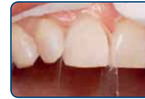
Nadat de ongeslepen tand is voorbehandeld met een zuur ziet het oppervlak er mat uit

Voordat uw tandarts de composiet aan uw tand plakt, behandelt hij uw tand voor met een zuur. Ook brengt hij een hechtlaag aan op uw tand. Op deze laag bevestigt hij de nog zachte composiet.