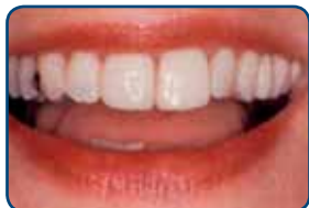
De facing van composiet heeft zowel de kleur als de stand van de tanden verbeterd