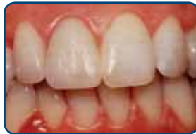
Op de tand is een porseleinen facing geplaatst