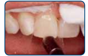
De hechtlaag is aangebracht