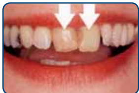
De tanden zijn verkleurd en staan niet mooi op een rij

Een facing gaat vijf tot tien jaar en soms ook langer mee. Roken en veel koffie of thee drinken, werkt verkleuring in de hand. Een facing kan slijten of beschadigen als u bijvoorbeeld tandenknarst of op uw nagels bijt. De tandarts kan een gesleten of beschadigde facing altijd repareren of vervangen. Deze behandeling beschadigt de tand zelf niet.