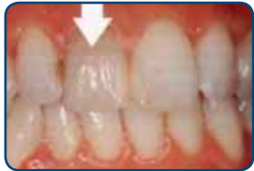
De tand is verkleurd

Tijdens de tweede behandeling brengt de tandarts de facing aan. Voordat de tandarts de facing aan uw tand plakt, behandelt hij uw tand voor met een zuur. Ook brengt hij een hechtlaag aan op uw tand. Op deze laag plakt hij de facing. Als u de vorm of kleur van de facing niet goed vindt, moet een geheel nieuwe facing in het tandtechnisch laboratorium worden gemaakt.